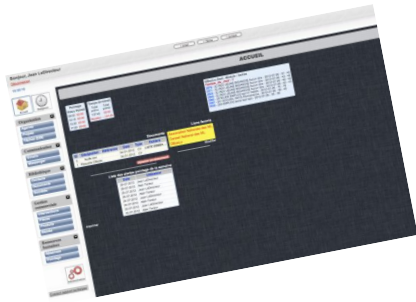
Page d'accueil OBooLo