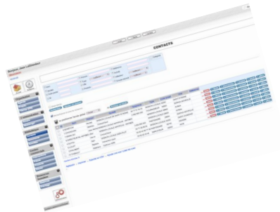
Gestion des contacts